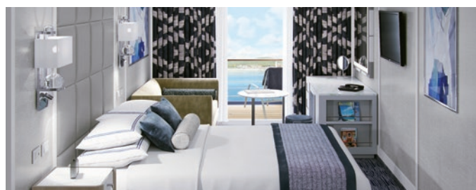
B1 | B2 | Veranda Stateroom, 20 кв м

Эти изящно переоборудованные каюты оснащены многими привилегиями пентхауса. Роскошь дополняется свежим новым декором, роскошными кроватями Ultra Tranquility, обновленными верандами с новой мебелью и эксклюзивными удобствами и привилегиями уровня консьержа.