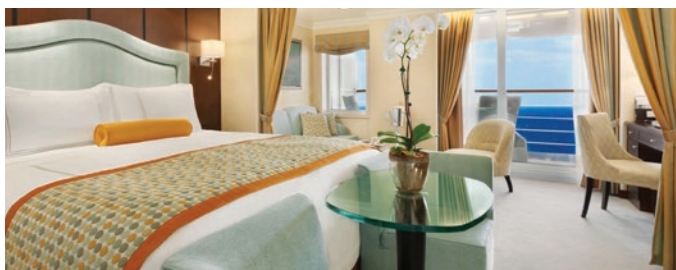
PH1 | PH2 | PH3 | Penthouse Suite, 39 кв м

Элегантный Penthouse Suites конкурирует с любой гостиницей мирового класса по комфорту и красоте. В каюте с оригинальным дизайном есть обеденный стол, отдельная гостиная, полноразмерная ванна/душ и отдельный душ, гардеробная и частная веранда. Гости этой каюты имеют доступ к частному лаунджу и услугам консьержа.