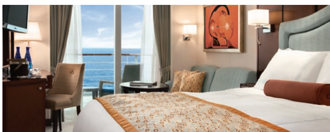
B1 | B2 | B3 | B4 | Veranda Stateroom, 26 кв м

Красиво декорированные каюты включают многие удобства, которые есть в пентхаусах, в том числе частную веранду, гостиную, мини-бар и просторную ванную комнату, отделанную мрамором и гранитом, с полноразмерной ванной / душем и отдельным душем. Гости также могут посещать частный лаундж с консьержем, где есть собственный консьерж, журналы, ежедневные газеты, напитки и закуски.