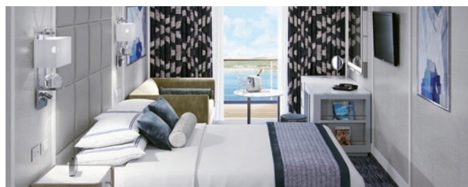
A1 | A2 | A3 | Concierge Level Veranda Stateroom, 20 кв м

Каюты Penthouse Suites украшены роскошными дизайнерскими тканями и мебелью в спокойных оттенках моря и неба. Гостиная представляет собой отдельную комнату, где можно поужинать. В гостиной зоне есть мини-бар и туалетный столик, а в элегантно оформленной ванной комнате вы найдете роскошную отделку из камня и душ.