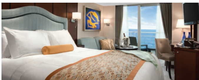
A1 | A2 | A3 | A4 | Concierge Level Veranda Stateroom, 26 кв м

Элегантный Penthouse Suites конкурирует с любой гостиницей мирового класса по комфорту и красоте. В каюте с оригинальным дизайном есть обеденный стол, отдельная гостиная, полноразмерная ванна/душ и отдельный душ, гардеробная и частная веранда. Гости этой каюты имеют доступ к частному лаунджу и услугам консьержа.